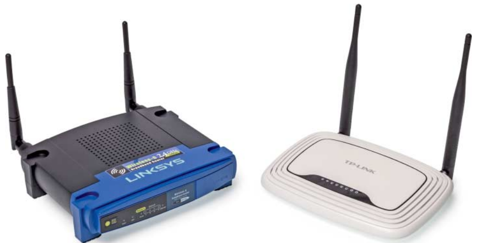
Der WRT54G von Linksys (links) ist der „Geburtsrouter“ der Freifunk-Initiative. Der günstigere WR841N von TP-Link (rechts) ersetzte ihn bald. Mittlerweile haben beide zu wenig Speicher, um zukunftssicher zu sein.

Gleichermaßen verhält es sich mit Internetzugängen: Wenn Sie einen Freifunk-Router aufstellen und mit Ihrem DSL-Anschluss verbinden, kann Ihr neuer Nach-